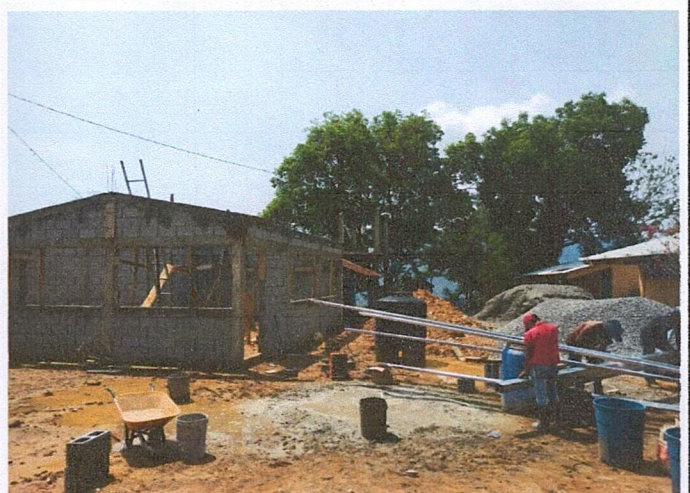
Foto 4: Se repara el techo y el piso de un aula del establecimiento.

Observación: Si es necesario se pueden agregar hojas adicionales, indicando el número de hojas.