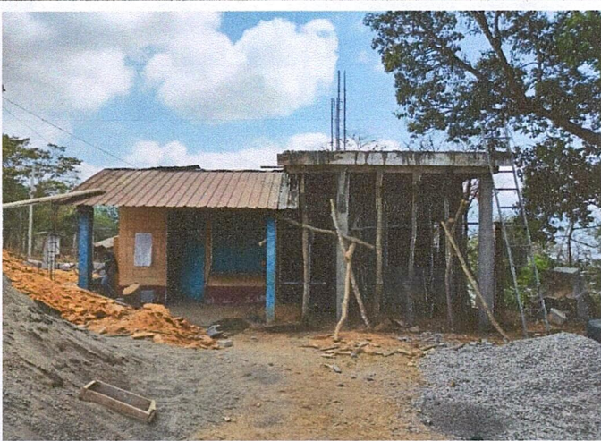
Foto 3: Mejoramiento en las instalaciones de la cocina, colocando una terraza para ubicar depositos de agua exclusivamente para el area de la cocina.