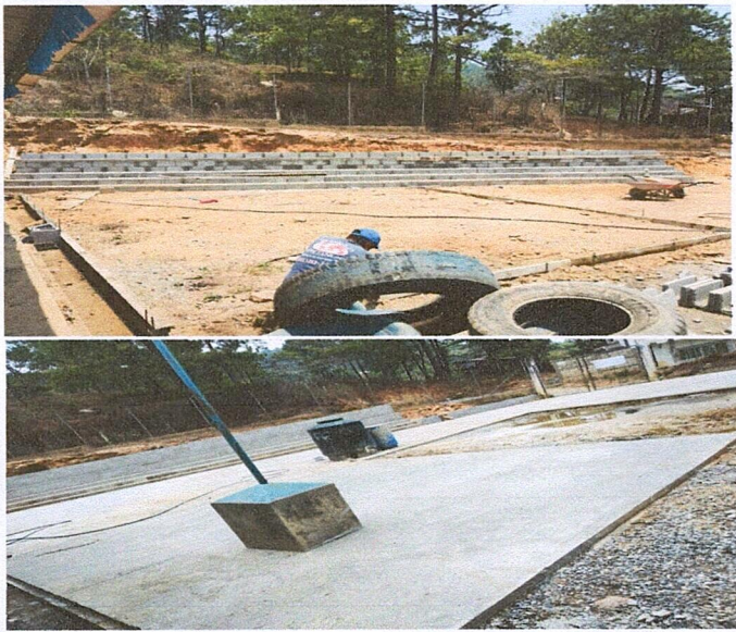
Foto 1: La loza del patio se transforma a patio de concreto para mejorar el ambiente recreativo de los alumnos y alumnas del establecimiento.